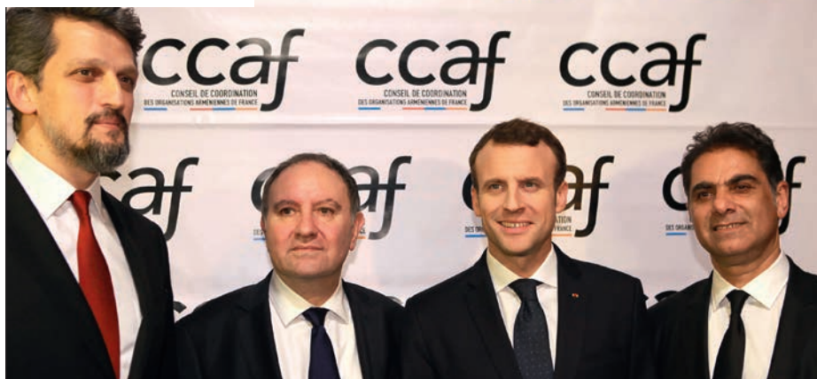
p. 8 / Le président Macron présent au dîner du CCAF.