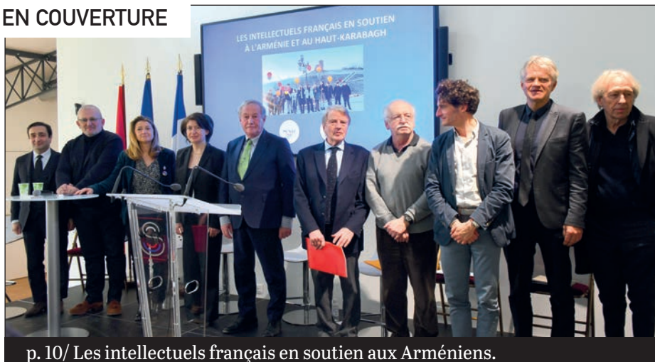
p. 10/ Les intellectuels français en soutien aux Arméniens.